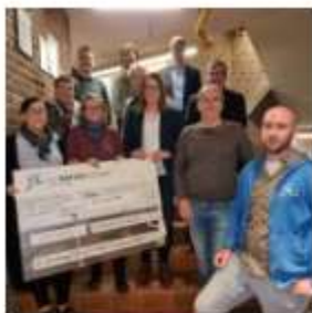
Februar 1, 2023 von AdminElmpt Keine Kommentare

Das Jahr 2023 startete für den Förderverein auch weiter erfolgreich. Nachdem wir bereits im November 2022 von einer Förderung durch die SL NaturEnergie Stiftung für unser Naturprojekt „Wer summt denn da?“ profitieren durften, erreichte uns Mitte Januar eine weitere Mail, die am 31.01.2023 zu einer Scheckübergabe im Rathaus führte. Unsere Freude war immens!